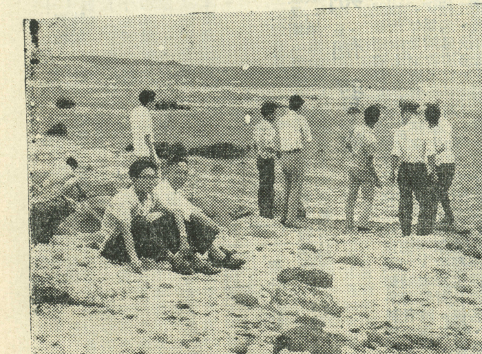
眺開邊海門石學同一醫