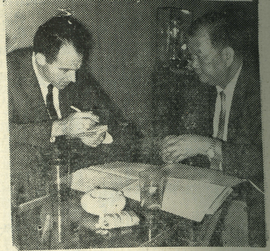
況概院學本明說士博克白向長院徐