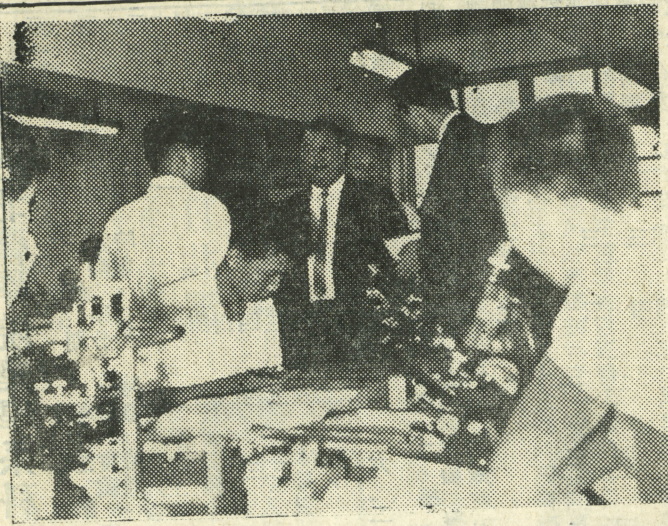
室驗實理物院學本觀參士博克白