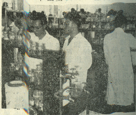
圖：化學實驗室之一角

化學實驗室於今年春季完成，現有藥品、儀器及設備已化費頗鉅，較諸其他醫學院或理工學院亦無遜色，目前研究作亦已擬訂計劃，一待訂購儀器設備充實即按增進研究興趣特編印本刊。 二、本刊暫定每