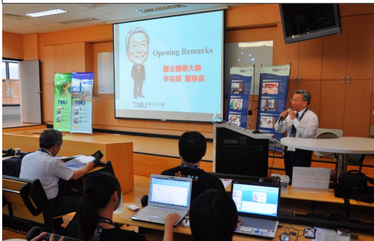
照片主題： 邱校長主講