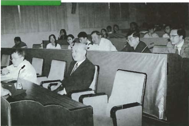
■ 流式細胞儀的討論會吸引了全校從事此方面研究者之注目

五、六月的北醫，為著她三十九歲的生日，飄散著一股節慶的氣氛。各單位與學生們準備為期一個月的慶祝活動，替北醫慶生。內容包括有學術發表、校慶音樂會和園遊會、社團與學系的成果展等等，既感性又理性。這些活動凝聚了全校的向心力，也讓北醫更活潑有朝氣。