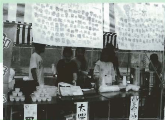
■同學們擺出各式小吃全力促銷