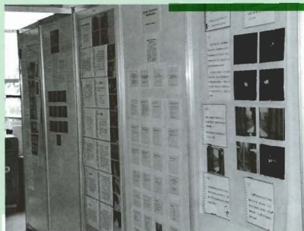
■ 壁報論文不僅內容精彩，版面的設計也有巧思

學生籌辦的各項節目可說是校慶系列活動的主力，包括動感的運動會與各學系與社團成果展。今年的校慶盃，分為籃球賽、排球賽、足球賽、和桌球賽，分別由籃球、排球、足球和桌球四個相關社團主辦，南友盃運動會則由北醫南友會主辦，共有十三所學校參加。藉著這些活動不僅可以活絡各系同學感情，凝聚全校師生向心力，並培養良好正