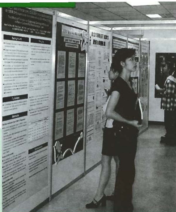
■壁報論文引起很大回響

當的運動風氣，同時也能夠和其他學校同學交流。事實上，據許多同學說那些不常活動的老骨頭都因這些競賽而動起來了。