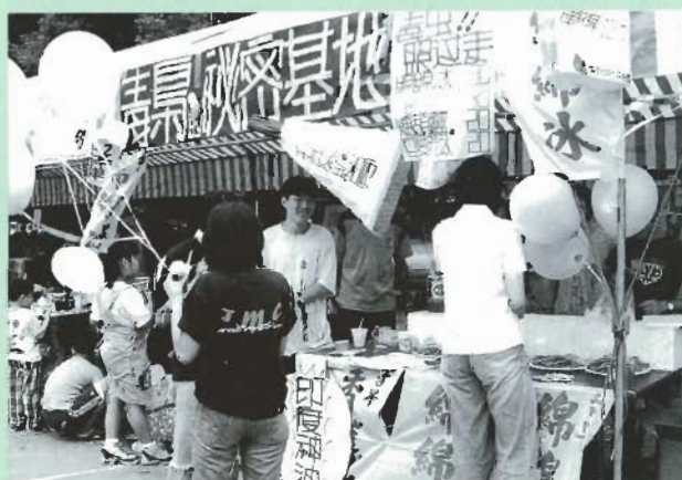
■園遊會現場熱鬧滾滾

傳統的攤位外，另一邊的足壘球場同時有精彩的足球冠亞軍賽及橄欖球邀請賽。足球冠亞軍賽是由學期初即開始舉辦的足球賽，經由一次次的淘汰，獲得最後勝利的兩支隊伍在當天做冠亞軍的爭奪戰。而橄欖球邀請賽更是邀請到建國中學的橄欖球校隊，蒞臨本校與本校校隊做友誼性的表演賽；