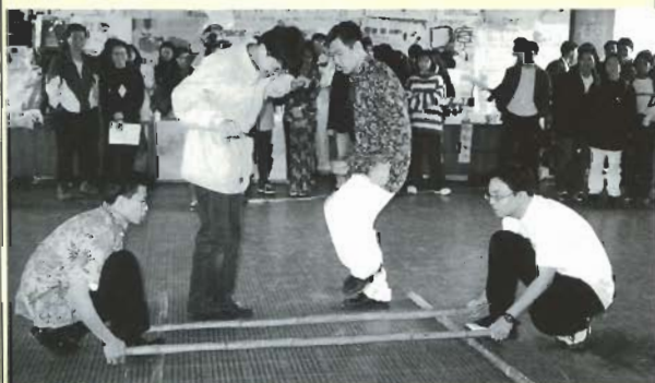
■「無國界」南洋風情--竹竿舞

本次活動在籌委會及所有僑生秉持堅定信心的耐力下，以最困乏的貧瘠資源發揮出最強大的活動成果，並獲得眾多師生的支持及參與，可謂圓滿達成。