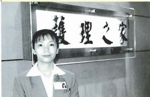
■護理之家媲美五星級飯店

因應社會高齡化與長期照護需求量的急遽增加，本院護理之家在眾人的期盼下，歷經三個月的籌備，通過台北市衛生局的設置申請，即將於八十八年四月十二日正式收案。本院提供專業的護理照護服務，擁有完整的醫療照護支援系統，設置人性化與家居式的生活空間，配置有新穎的照護設備。