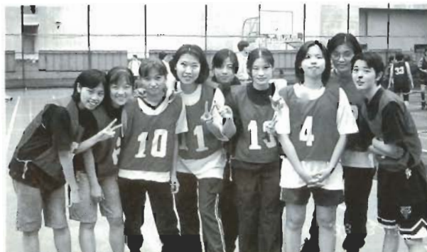
■醫管系女籃隊掛於台中中國醫藥學院

本校醫管系四十位同學於三月十三、十四日參加了位於台中中國醫藥學院醫務管理學系所主辦的中華民國第二屆全國大專院校醫管盃的活動。此次參加的隊伍包括中國醫藥學院等五所學校之醫務管理學系。此次活動，本校醫管系共獲男子籃球賽冠軍、混排冠軍及精神總錦標，再次證明本校醫管系同學的團結及實力。