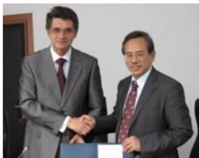
【左圖：邱校長（左2）與亞雷大學校長（中）簽訂雙邊姊妹校協議書】