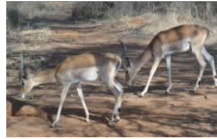
【圖：左為世界第二大岩石：Sibaba Rock，右為正在低頭吃草的羚羊】