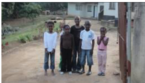
【圖：左為筆者與當地朋友的小孩合影，右為當地小孩天真燦爛的笑容】