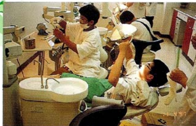
「萬芳小天使，健康魔法師」活動，小朋友至牙科部實際操作情形

4月11日及4月12日於萬芳醫院舉辦之兒童保健營，希望藉此活動能讓小朋友學會如何照顧自己的