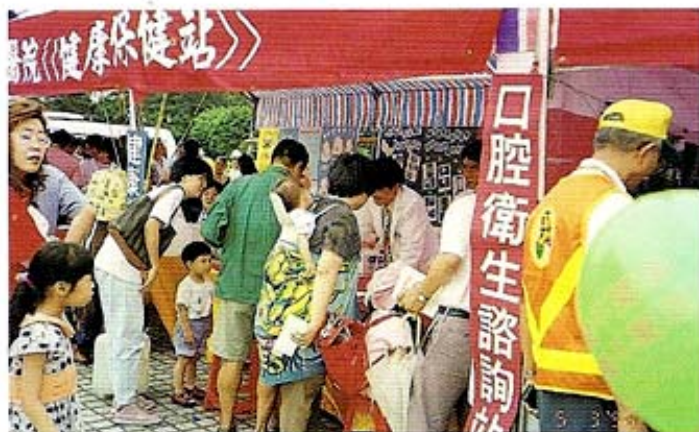
人潮洶湧，北醫附醫牙科部口腔衛生諮詢站受好評

附醫牙科部實習的人數為22名，比今年多6名，而且附醫牙科部也是該屆牙五熱門的實習場所，牙科部將於五月二十四日假「福臨門」餐廳舉辦「迎新送舊」餐會，同時也將歡送六月底離職的R及護士小姐，並歡迎將上班的新R與護士小姐。