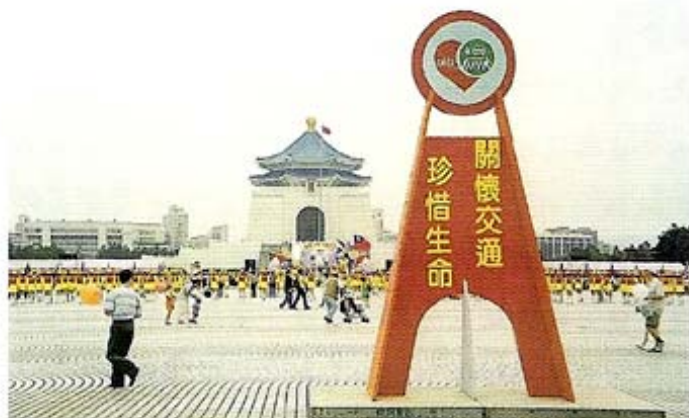
北醫附醫牙科部參加5月3日在中正堂舉辦之「關懷交通，珍惜生命」大型公益活動