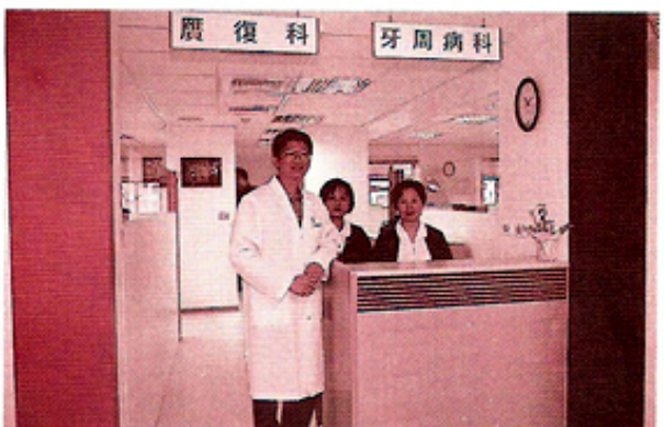
圖10.廣復科及牙周病科門診入口櫃台。