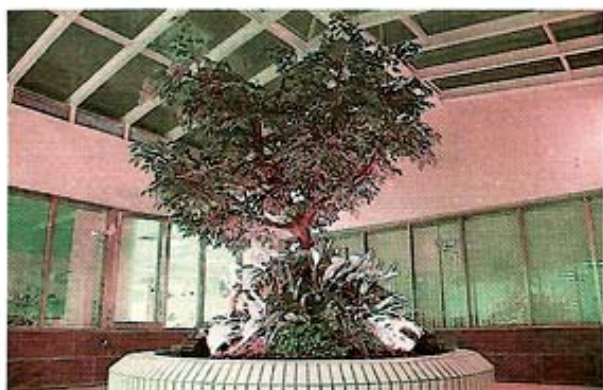
圖5.門診部室內中庭花園夜景。