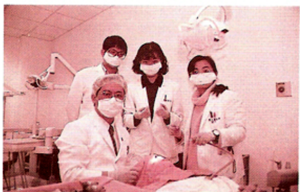
圖9.口腔顎面外科門診開刀治療。