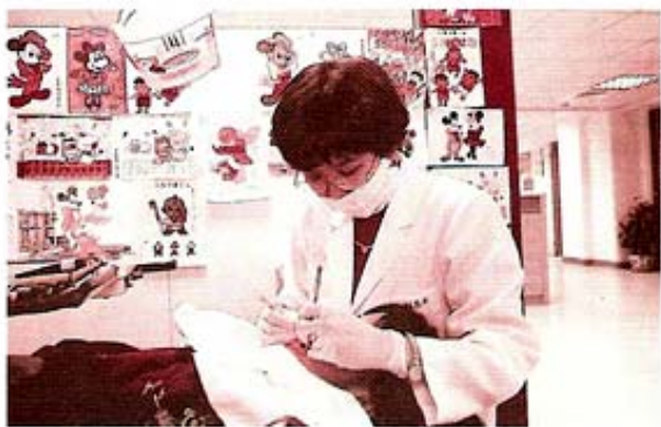
圖7.兒童牙科繪畫牆。