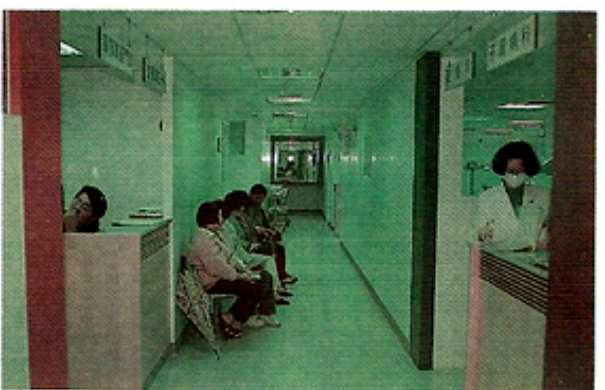
圖11.候診走廊之一景。

紙媒體看到這項公益活動的造勢及有獎徵答活動，為塑造北醫附醫牙科部更好形象，及踏出校園與社會脈動結合之最大步！