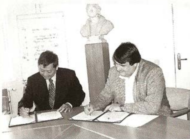
▲ 北醫口腔醫學院林院長(左)與柏林大學醫學院院長(右)簽約締結姊妹校