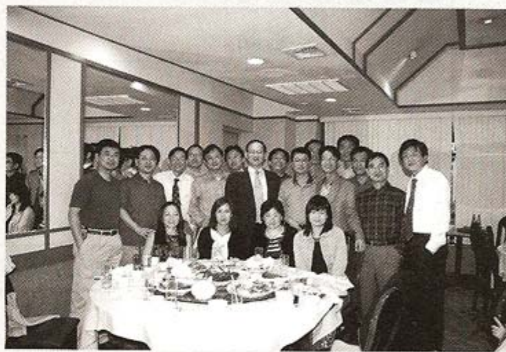
▲ 在波士頓定居的北醫

Jacobson DMD, MSD 帶領下的三位教授來台作一連三天的進階課程，超過百位醫師參與盛會，讓國內的醫師不用出國，便能獲至與世界同步的植牙知識與技術！