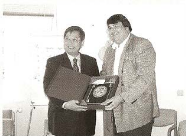
▲ 簽約完雙方互相贈送禮物