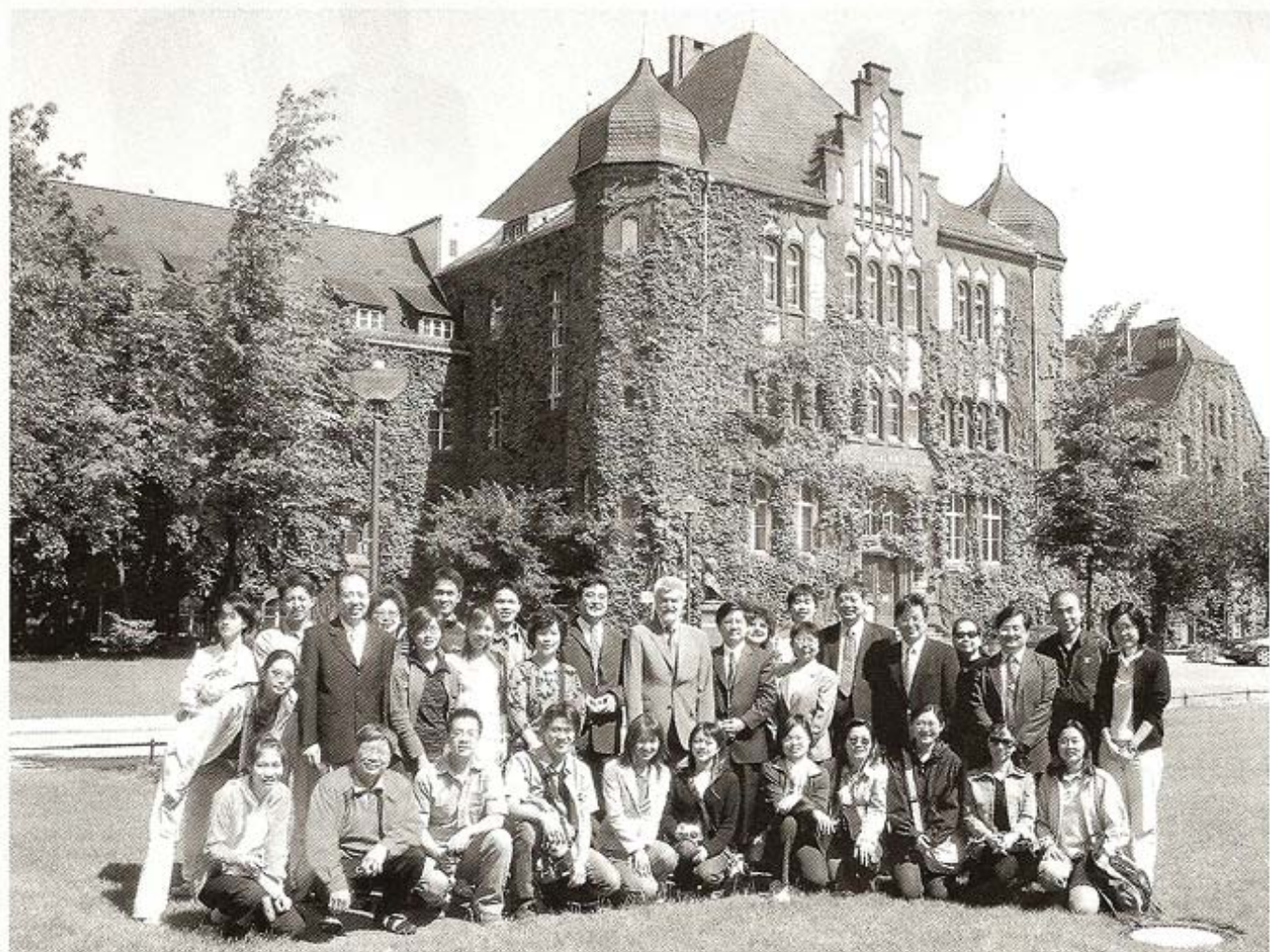
▲全體團員於柏林大學校園內留影