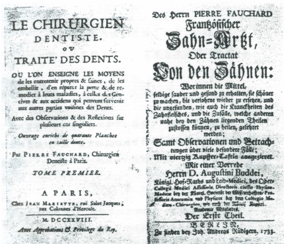
圖 1. 「牙科外科醫或牙齒的療法」首版首頁。 左圖為 1728 年法文版。右圖為 1733 年德文版。 (圖中文字參酌上期(四)末頁)