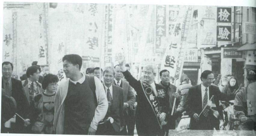
參選第三屆國民大會代表一景

，去年產業總值高達 3 千 2 百億，吸引許多科技人才，國家高科技的研發中心也設在園區內（包括工研院、太空計劃室、同步輻射中心、國家精密儀器中心）。2. 文化古都：在 104 平方公里內，有 12 處內政部指定的國家文化古蹟，古蹟密度居全國之冠，從清代中葉以來，有其光榮的歷史淵源與鼎盛的文風。在過去 10 年正當科學園區蓬勃發展，而新竹市政建設卻完全停頓，10 幾項公共建設，沒有 1 項順利完工使用，對一個新竹人來講是非常惋惜與痛心！所以抱持著長期準備以及想挽救現在的迫切心理，積極投入選戰，希望以政策扭轉與執行躍進彌補過去 10 年的荒廢！並將新竹市定位成“亞太科技首都”，作為台灣城市的典範。