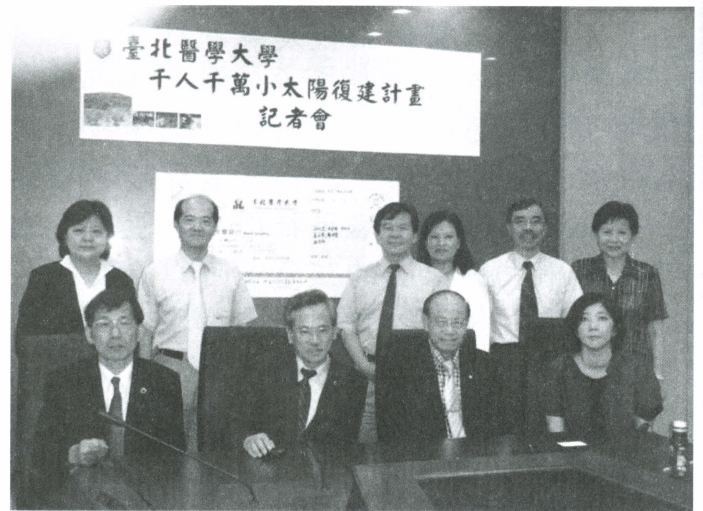
千人千萬小太陽復健計畫記者會