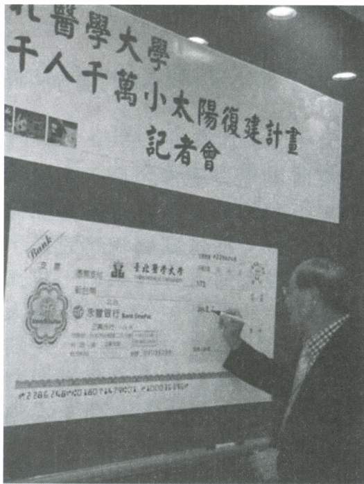
康理事長參加千人千萬小太陽復健計畫記者會活動