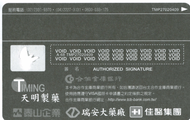
北醫達人認同卡-捐助單位