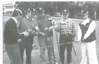
球友們認真在討論用哪一支球桿可以打得最遠