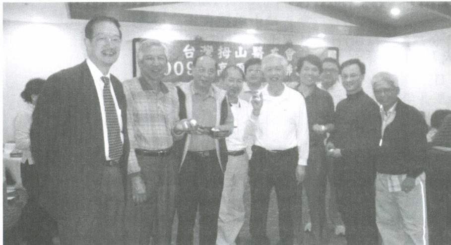
得獎貴賓與頒獎者大合照