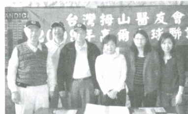
報到前工作人員大合照