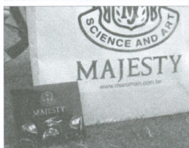
參與擊遠賽的貴賓每人皆可獲得MAJESTY TEE一組