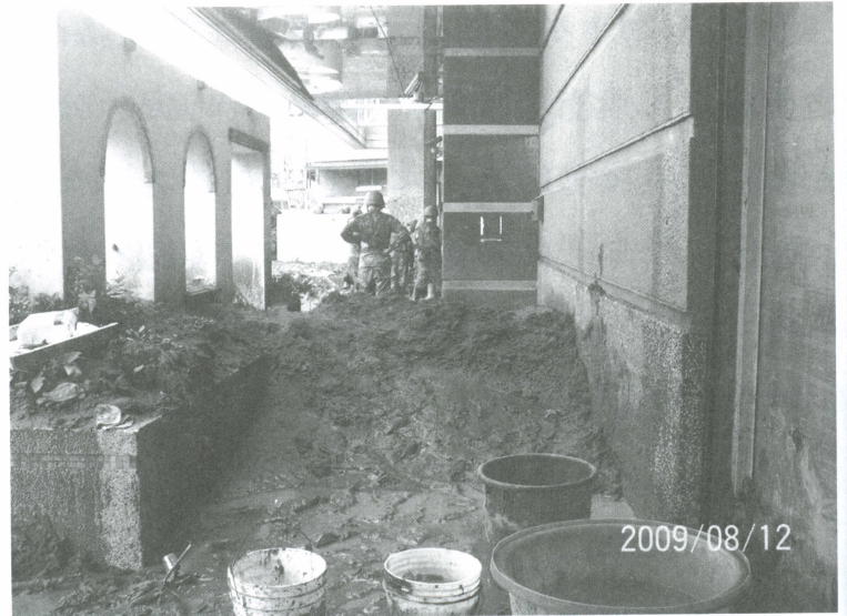
國軍協助清理廣聖醫院。

第三天上午開始，有如野戰部隊的作戰方式，在推土機的前導，軍隊後勤的合作下，把大量的土石運到醫院周圍，因為受災面積太廣，即使到了第三天，鎮公所依然沒有辦法清除堆在路上的土石，。加上醫院內部清出的土石，簡直是堆積如山，老天爺幾小時的肆虐，就讓人如此的不堪，此時才知道，原來人定勝天只不過是夜郎的夢囈而已，一樓的土石在三天內清除完成，