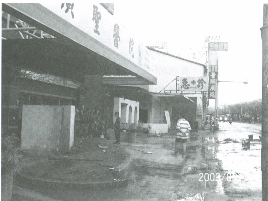
八八水災後廣聖醫院外觀。

人生路上我們總以為過一個自己滿意的日子是天經地義的事，面對順境就歡天喜地，面對逆境則如喪考妣，因此造成人生的喜怒哀樂，心念隨之起伏不定，顯現出來的就是人間的眾生相。