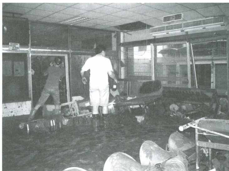
廣聖醫院內淹水實景。

內，此時水流已經超過膝蓋，洪水大量灌進車內，幸好車子依然可以發動，在緊急狀況下，我將車子往高處的中華路頭後退，大約 150 公尺後，才從警察局所在的福中街轉彎離開淹水區域，此時廣聖醫院已經淹水一樓高，我們已經無法再進入醫院，只好在較高的延平路觀察狀況。逃難的過程，至今依然心有餘悸。