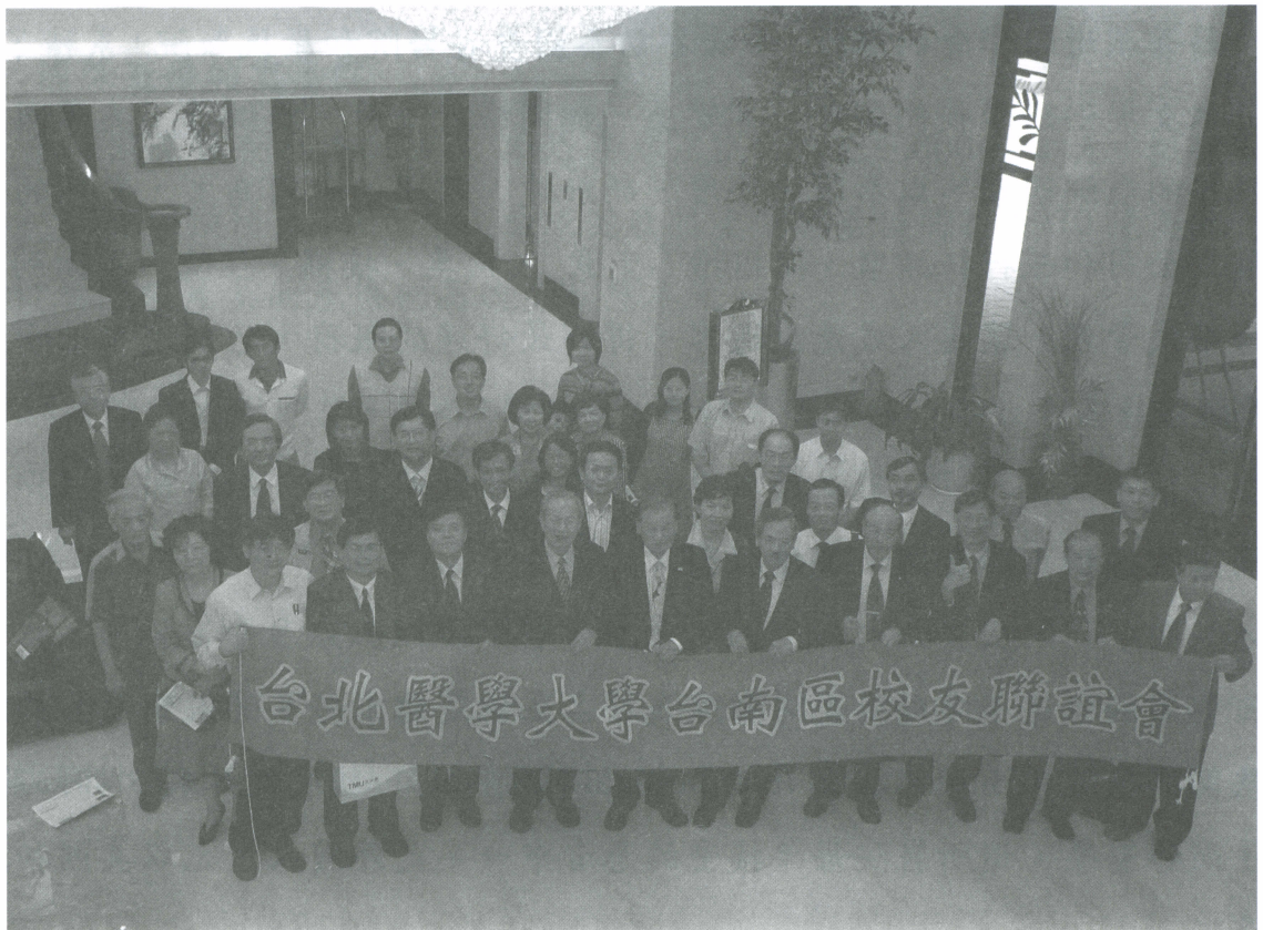
2009 年 2 月 14 日台南區校友聯誼會。

最近在媒體上常常看到醫療糾紛的事件，許多醫生被判刑、被關在牢裡，因為付不出高額的賠償金（甚至高達 2600 萬），沒有任何職業的工作人員會被這樣的懲罰（因為會破產），在美國醫師沒有刑事的責任，只有民事的問題。台灣其實也可以學學美國的做法，設立醫害救濟基金（像藥害救濟金一樣），給不幸遇害的病人一點補償，這樣社會才會圓滿（例如看一個病人，醫生出一元、診所醫院出一元，政府再相對出一些錢），不然在台灣當醫生實在太危險。也奉勸學弟、醫學生們一定要及早推動這些工作。不然在台灣當醫生實在可憐，學弟們請對這兩件事加把勁趕快推動醫療糾紛不必受刑法的追訴，這樣你們才有幸福的日子可過。