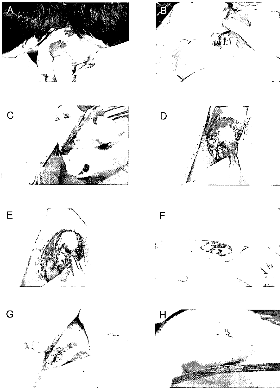
圖一、破壞十字韌帶誘導兔子關節炎之動物模式之手術步驟圖