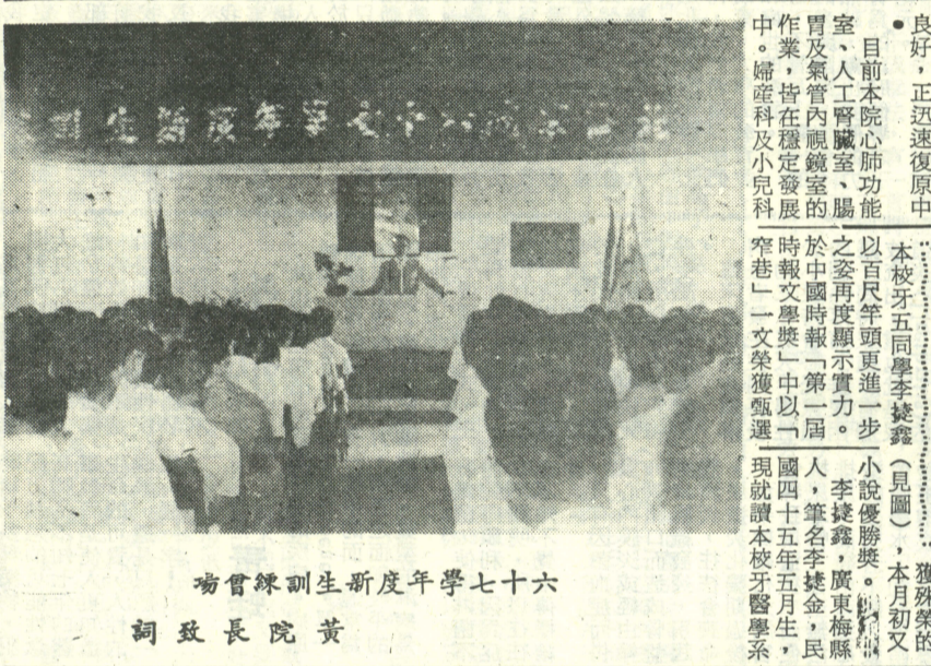
黃院長致詞 七十六學年度新生訓練會場