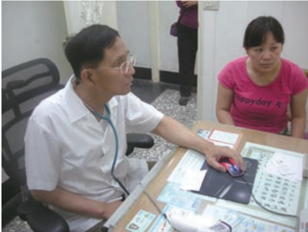
全文章儘管行動不便，仍堅持為族人看診