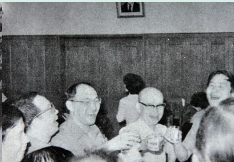
1. 魏火曜夫婦與中央研究院院長胡適及俄亥俄州立大學醫學院院長Doan於1957年10月17日攝於中研院