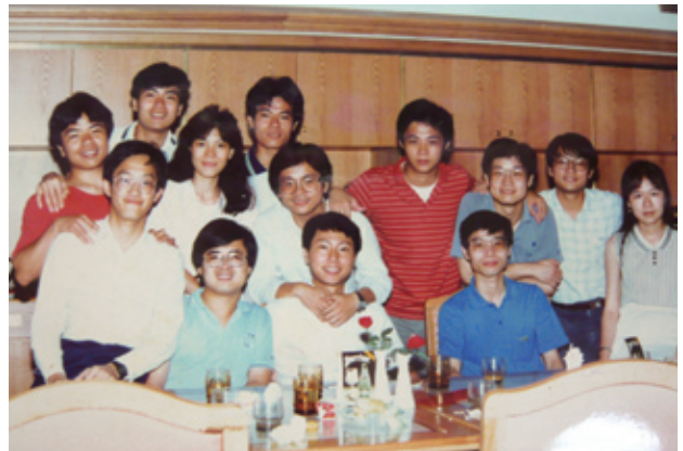
1987年5月三普飯店送舊

1991-2002年桌球代表隊成績起起伏伏一直無法突破，最大的原因是苦無訓練場地，簡陋的桌球教室（拇山學院地下室B2），當時桌球桌、桌球擋板都是靠學長、姐義務贊助，當時