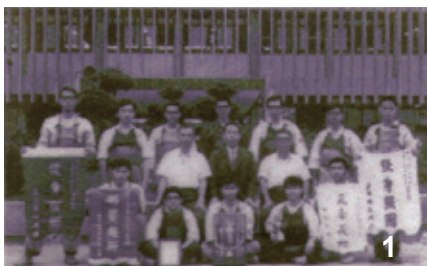
1. 第六屆中上學校擊劍錦標賽冠軍（1969年）