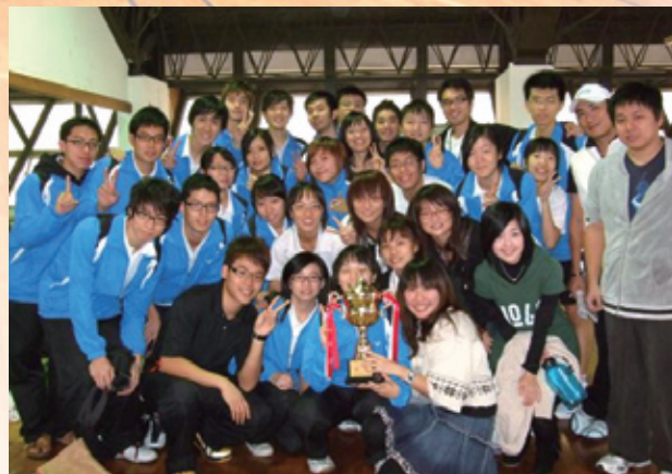
羽球隊男團榮獲全國醫學盃冠軍三連霸、女團亞軍

2005年起至今的全國醫學盃羽球比賽項目終於在「有場地」的情況下開打，北醫羽球隊自2005年至2009年五年間獲得了全國醫學盃男子組團體賽四次冠軍（2005、2007-2009年三連霸），一次第四名，女生組則於2005、2006與2009年獲得第二名。另外參加校際比賽所獲得