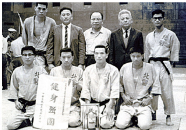
參加新竹市全省柔道錦標賽，賽後合照

雖然是課後的活動，但是為了爭取校譽，每位隊友的練習都相當認真，當然訓練也很嚴格；訓練場地是教學大樓的川堂，須先鋪榻榻米才能開始及練習；每次練習都必須從樓梯間將數十個榻榻米搬至川堂，在夏天時，隊員們就已經是滿身大汗，接著由隊長或資深前輩指導護身倒法約二十分鐘，再練仰臥起坐，伏地