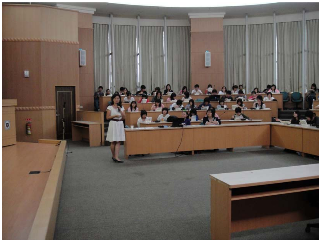
講座開始了~參與國際志工的策略與管道~大家都很認真