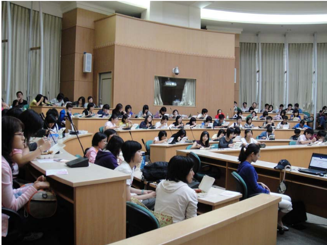
會議室滿滿的人，同學們也很認真作筆記~