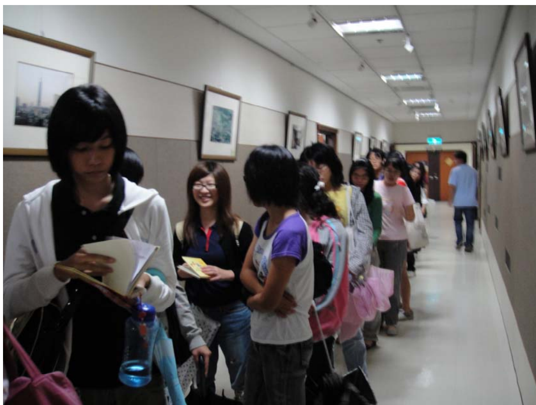
排了好長一排喔~大家都很踴躍!