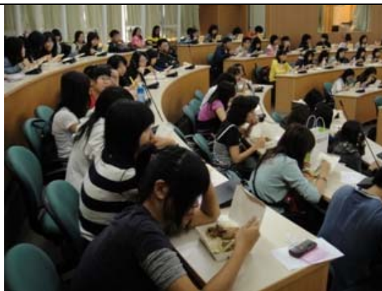
人山人海，大家都很有專心!