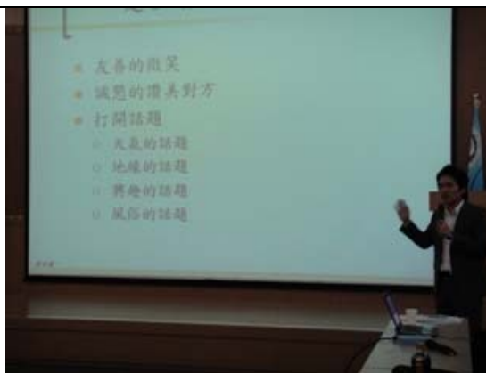
溝通有很多小技巧喔~