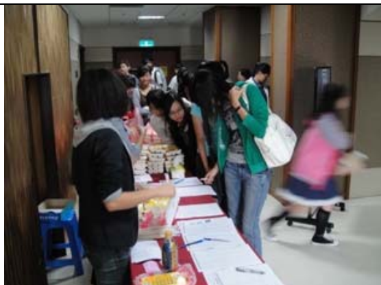
報到處~今天人很多!!