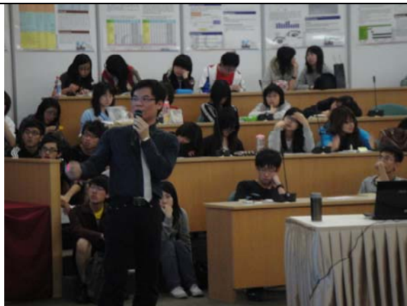
同學請看!哥本哈根氣候峰會