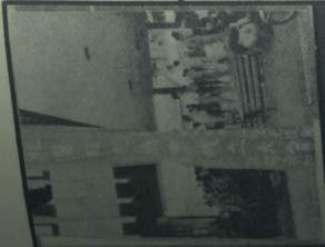
第十四屆北醫專校友會留影