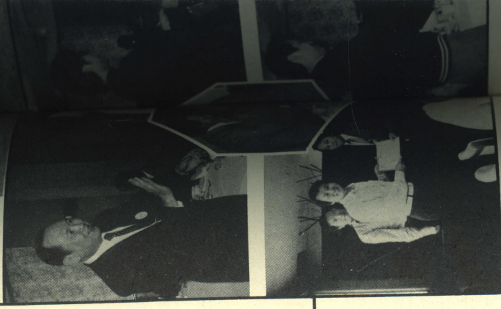
醫科校友會成立大會合影