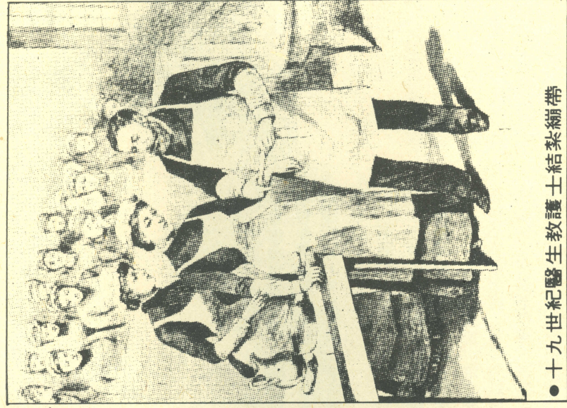
●十九世紀醫生教護士結紮繃帶