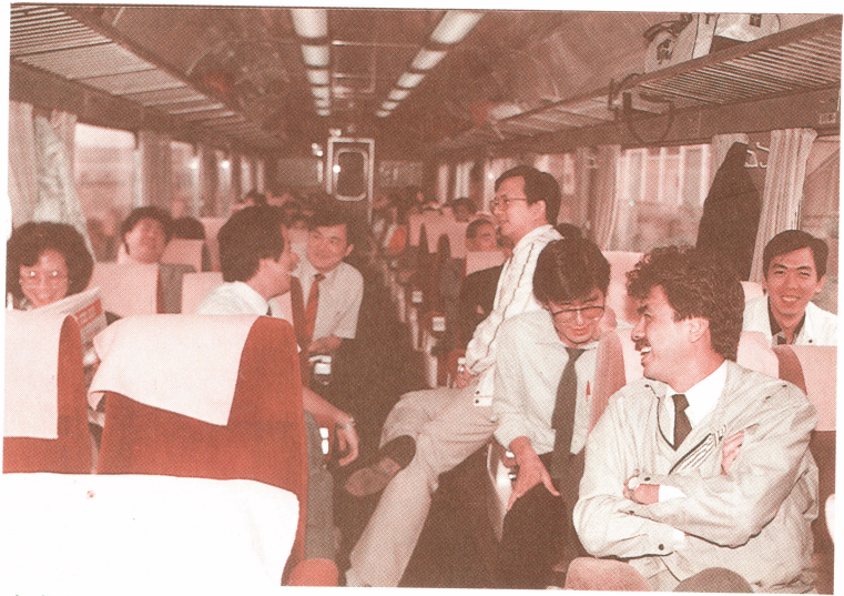
火車上(含 Ortho、Endo 主講者)

教室的燈光又亮了，Slide 已放畢，開始討論了；而我們也已進入讀秒的時間，因為 7:00 下課我們必須趕上 7:15 的火車或是 8:20 的飛機，好想讓講員與學員多聚一些時間，多回答一些問題，但火車抑或是飛機都是不等人的。