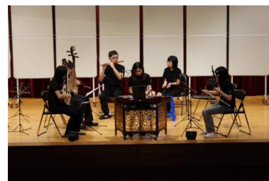
絲竹室內樂冠軍 禪劍