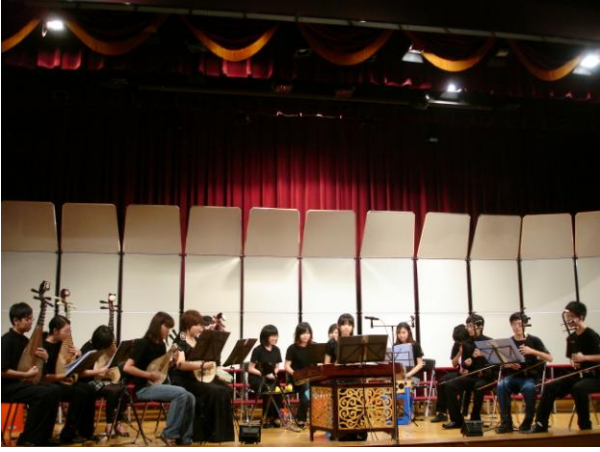
臺北醫學大學國樂社 霏雪