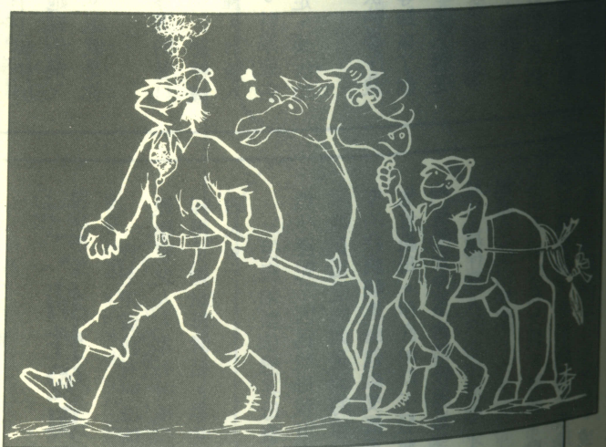
文·李友中 圖·柯毓賢