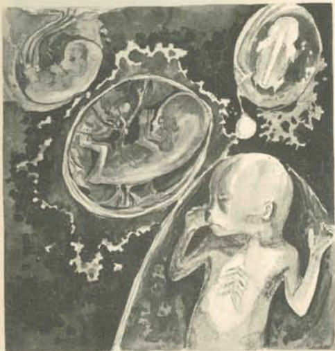
封面設計 劉豪文 何信重 題目 孕育