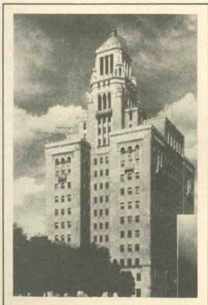
（圖2） 圖左：羅徹斯特鳥瞰圖 圖右：梅耶醫院布倫傑大樓全景