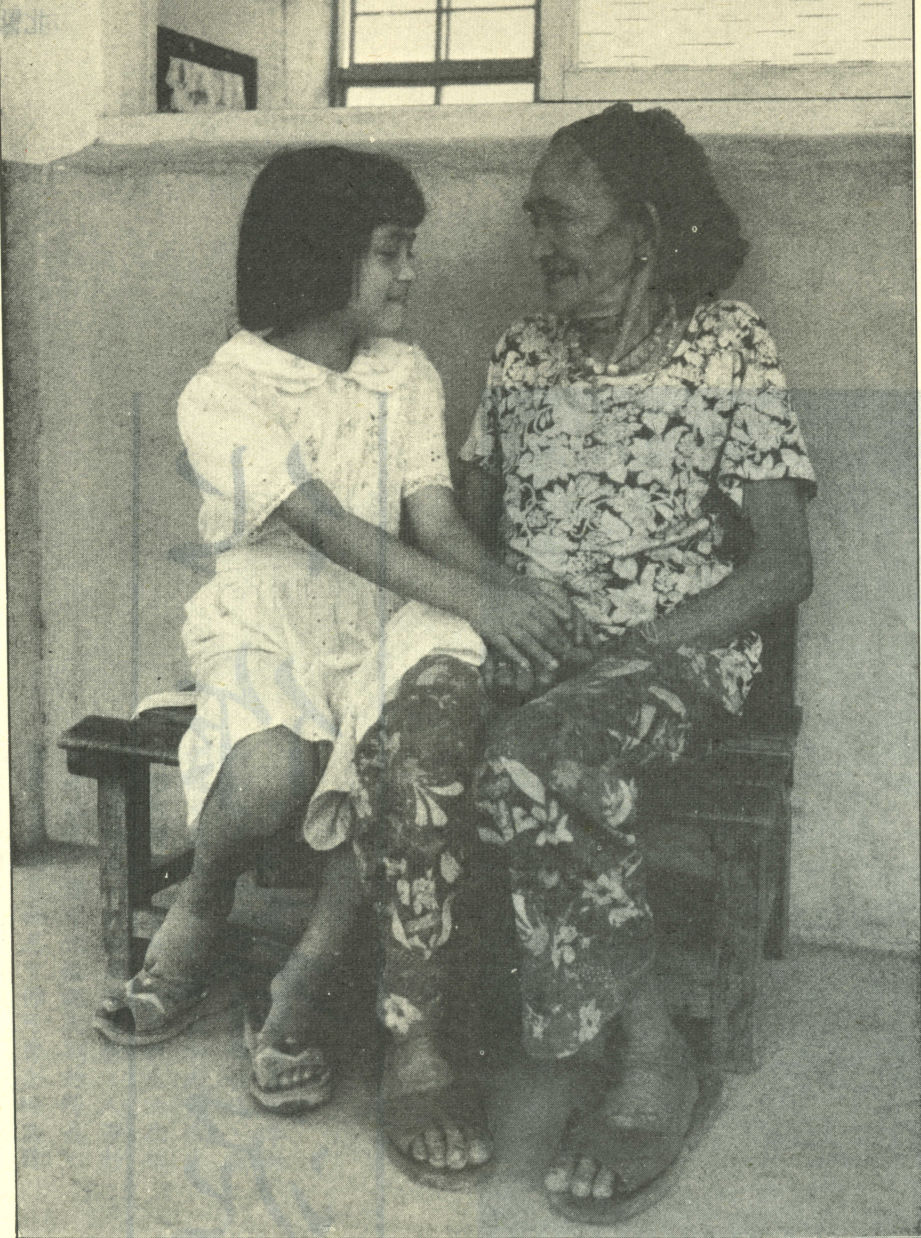
！快愉多處相少老，旁在侍陪 女孫小，了病看去祖老▲