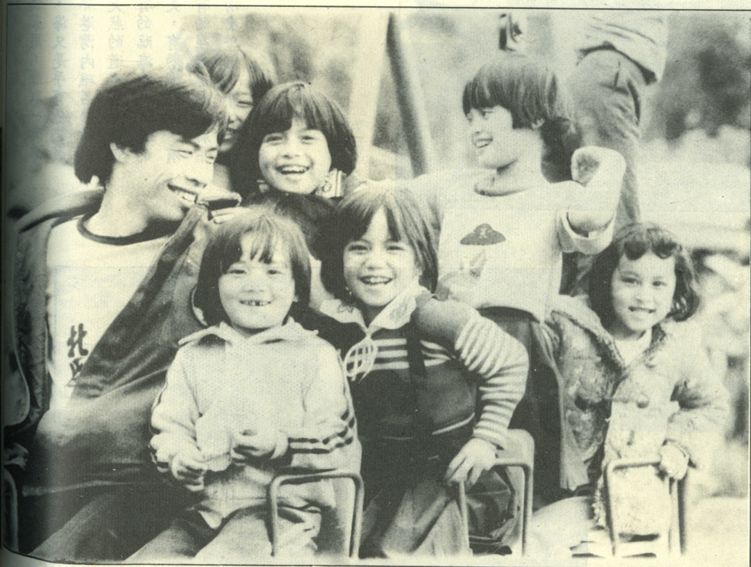
▲ 樸純又真天，染感的明文市都過受曾未們他，子之林山是童孩雅泰