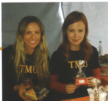
本校國際日園遊會，各國同學大展身手（左起芬蘭、韓國及日本、甘比亞）