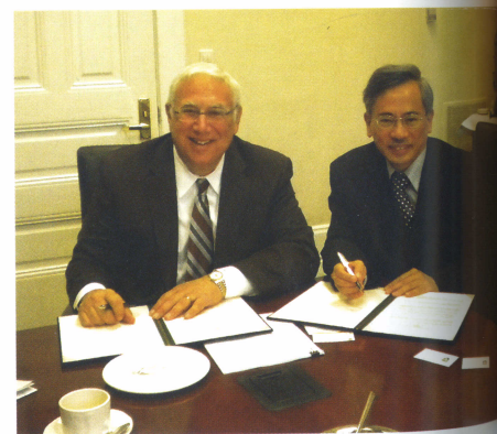
與美國塔夫特大學(Tufts)簽訂姊妹校(上圖)及杜蘭大學(Tulane University)簽訂姊妹校