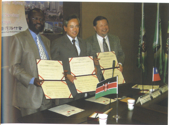
■ 2009年肯亞衛生部長與北醫、路竹會簽署醫護人員合作備忘錄