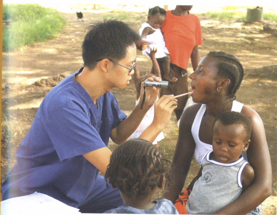
■ 駐聖多美醫療團義診情形