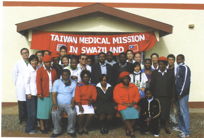
■ 史瓦濟蘭醫療團與前來協助之公衛護士合影

為了與國際同步，北醫積極參與及主辦國際研討會與醫療展，如：主辦第37屆、第40屆亞太公共衛生學會世界大會（APACPH），以及2008年臺北國際醫療展、2009年美西醫療考查團、香港國際知名保健醫療服務會暨展覽會等。在國內的醫療服務方面，則成立了國際醫療發展基金專戶及建置「TMU Healthcare System」網站，以提供外籍人士快速便捷的醫療服務，發展國際性的醫療業務。