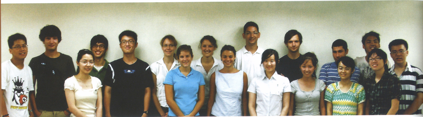
來自 Austria、Bulgaria、Czech Republic、Germany、Italy、Poland、Sweden、Switzerland、USA 等9國的16位國際學生在附設醫院進行觀摩學習