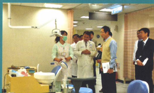
社會責任 ( CSR ) 驗證委員訪查特殊需求者口腔照護中心