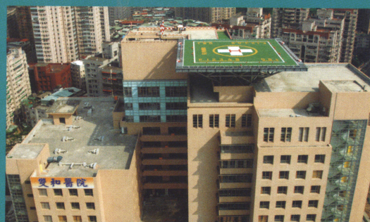
擁有臺北縣唯一民航局核准之醫療用停機坪