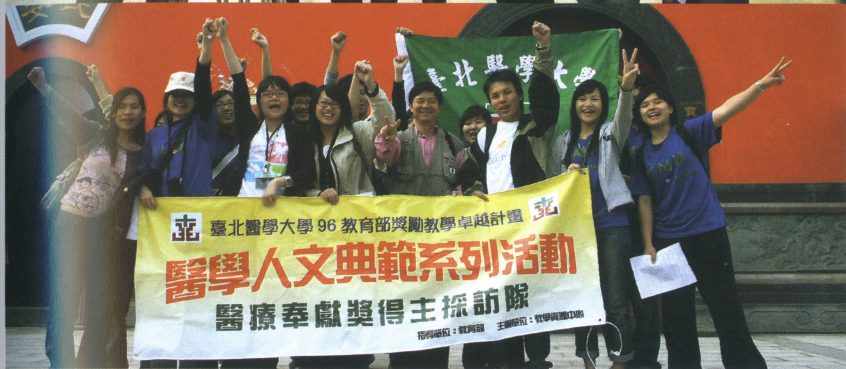
教學卓越計劃課程「醫學人文典範系列活動」，由同學訪問本校多位醫療奉獻獎得主