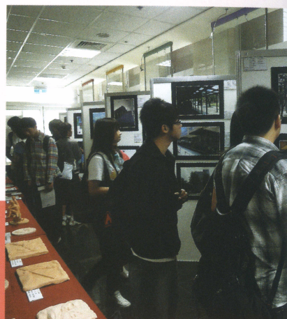
通識藝術課程聯合成果展