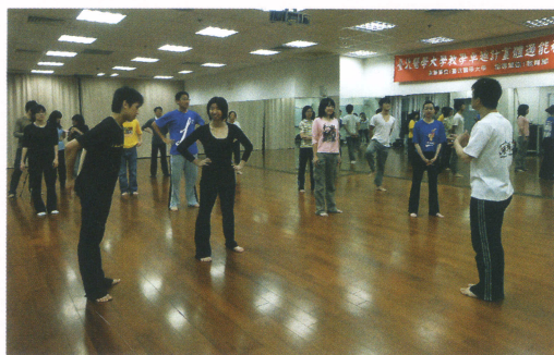
教學卓越計劃課程「身體美學工作坊」