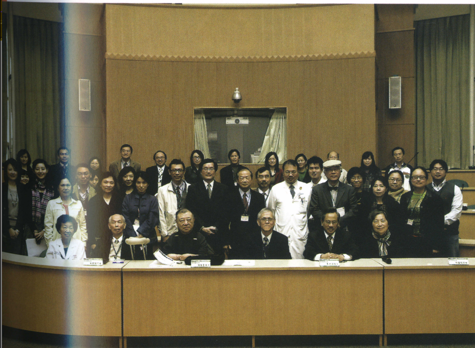
許倬雲等六位中央研究院院士（左圖），協助本校完成了「通識改革白皮書」（右圖）