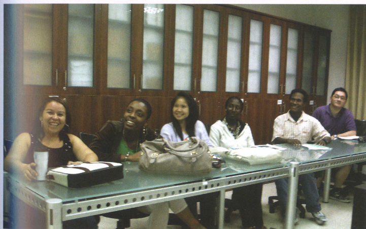
■ 醫管所國際學生上課情形

■ 網址： http://phn.tmu.edu.tw/2009/index.asp