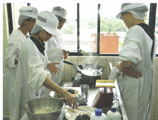
保健營養系學生進行病人飲食烹調

有鑑於國際化、跨領域整合已是學術界在教學與研究的重要趨勢，本學院未來將透過共同願景的塑造、組織調整、課程改進與教學品質提昇、研究品質提升與能量擴增、教師人力延攬與素質提升，研究資源引進、組織文化的塑造、國際化程度的加強等八大方向，擬定具體策略，將學院的教研提升到國際一流水準。同時，本學院將培養具有核心能力、職場競爭力的優秀學生，使本學院成為國內相關領域學生的首選。最後學院將提供優良的教研環境，供每位教師能不斷自我成長，並且有一個健康快樂的職涯。