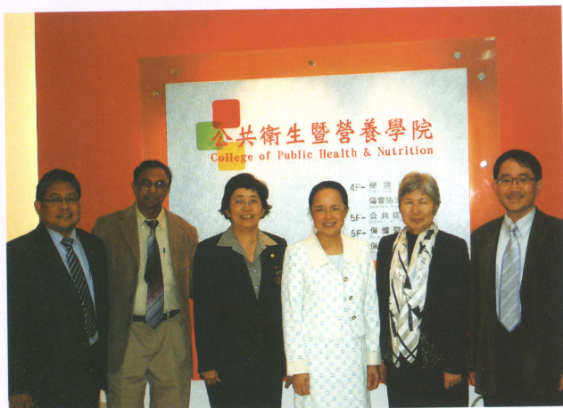
■ 學院主辦亞太公衛聯盟會議