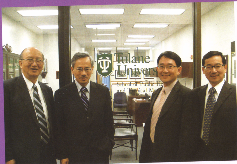
■ 學院赴杜蘭大學簽訂姊妹校

公共衛生暨營養學院與國內其他公共衛生學院最大的差別，在於擁有保健營養及傷害防治兩個學術單位，使得本學院在職場健康促進、營養與肥胖、事故傷害防治等領域居於領先的地位，而統公共衛生重要領域如流行病學、醫務管理、社區衛生亦在國內扮演舉足輕重的角色。