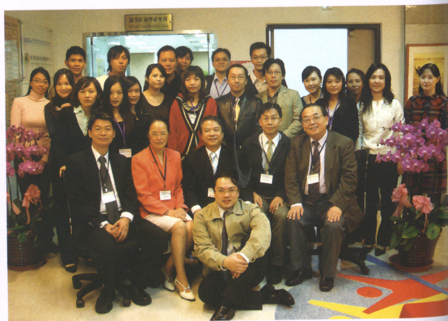
■ 傷害防治所系所評鑑時合影