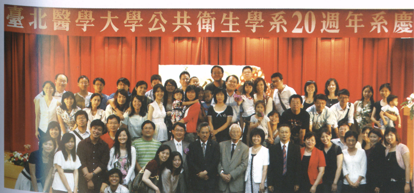
公共衛生學系成立20周年暨系友會成立大會