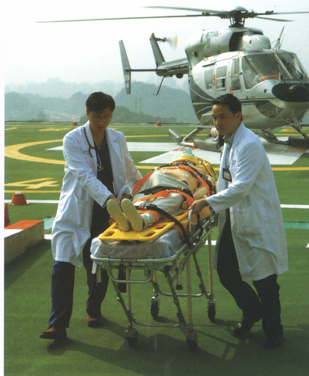
■ 空中轉診制度演習