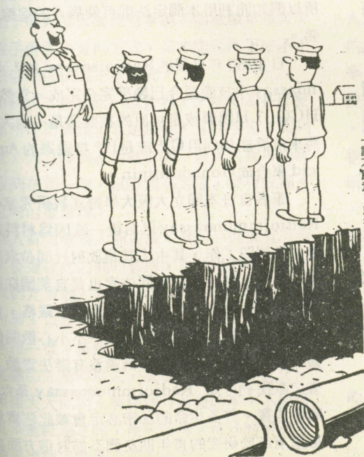
「誰不願意，就後退兩步！」