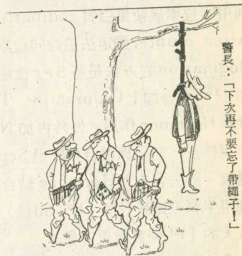
警長：「下次再不要忘了帶繩子！」