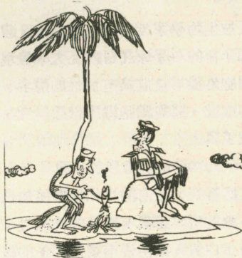
船長：「快點！你不知道我已幾天沒吃飯了嗎？」