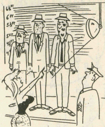
「。貌體不我對位這是一：女