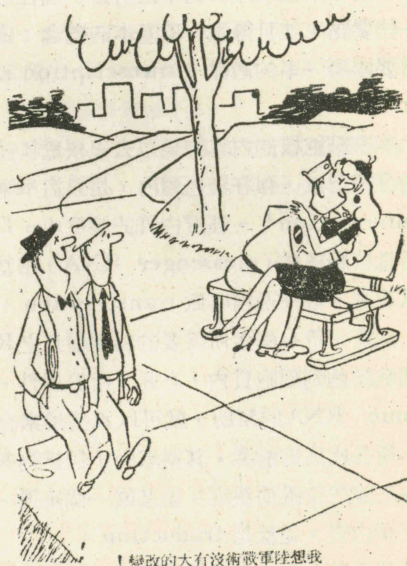
！變改的大有沒術戰軍陸想我