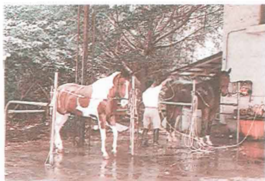
圖四：洗馬、圖左之花馬即筆者愛駒

當只有單騎出野外時，馬兒會顯得懶洋洋的，兩步一回頭，看看背上的主人，一付「怎麼還回不去？可以回去了嗎？」的眼神。而一羣馬一起走就完全不同了，馬匹個個精神抖擻，爭先恐後，當其中有一匹起跑的時候，其他一定跟著跑，而且拼死都要