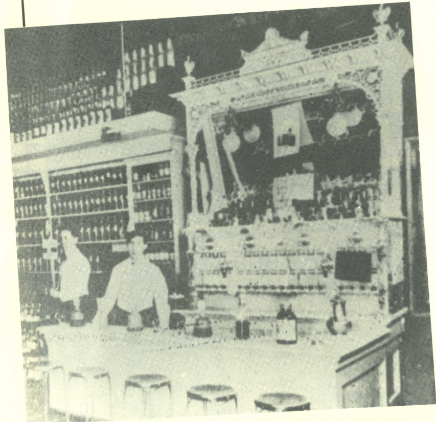
藥劑師在美國逐漸成為藥品商人，批售商以及糖果和化粧品的代理商（約攝於西元1880年）