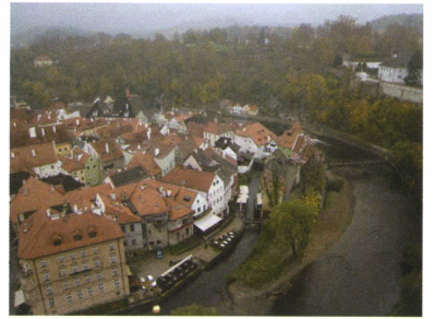
夢幻古城-傑斯基庫洛夫