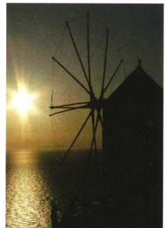
希臘伊亞的落日與風車

與喜悅，真的就像吸毒般，一不小心就一而再、再而三的染上了無可自拔的癮頭。諸如號稱世界最美麗的希臘伊亞落日、米克諾斯島一系列浪漫無比的藍白建築與風車; 西班牙聖家堂、米拉之家、奎爾公園等驚世搞怪的高第著名大作; 捷克卡羅維瓦立充滿貴族氛圍的溫泉勝地、聯合國教科文組織評選的夢幻文化古城遺跡—傑斯基庫洛夫等等。而我這心靈飽足的旅人，也早已將這一次又一次美妙愉悅的遊程記憶，接連穿起為一串美麗的珍珠項鍊，用來裝點我瑰麗的璀璨人生。