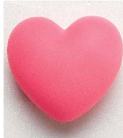
誠 摯 的 心