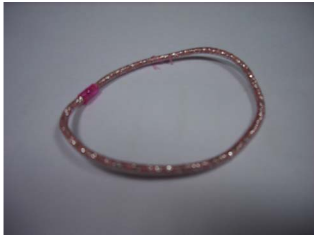
亮 色 髮 圈