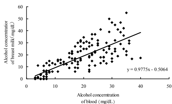
Fig 3. Correlation between blood and human milk alcohol concentration after consumption of chicken soup cooked with sesame-oil and alcohol

乳量顯著減少，而10人則顯著增加 (Table 2)。哺乳婦體內泌乳激素的分泌量和乳房吸吮刺激，為乳汁的分泌量重要的影響因子。本研究結果顯示，攝取麻油鷄酒湯對於哺乳婦的泌乳量，以及其體內因乳房刺激所引起的泌乳激素分泌量，皆無發現顯著的一致性，此與過去相關的人體和動物研究結果並不相同。由於攝取麻油鷄酒湯和麻油鷄湯相比較，有13人(全母乳：部分母乳餵哺=6：7)泌乳量有顯著減少的情形，而10人(全母乳：部分母乳餵哺=6：4)則是呈顯著的增加，故將兩組受試者資料做影響泌乳量之相關因子間的比較，但並無發現有所差異。推測可能因素包括酒精攝取劑量、酒精攝取型態、個人飲食習慣、實驗材料中的其他成分及母乳餵哺習慣等。