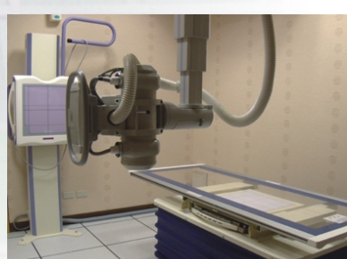
一間間獨立的檢查空間,讓民眾的隱私更有保障