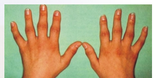
類風濕關節炎造成手指關節微微變形(初期)

若符合4項以上者,即可診斷其罹患了「類風濕關節炎」;而此疾病還會伴隨發燒、肌肉痛、倦怠感、乾眼睛或乾嘴巴等症狀;少數嚴重的類風濕關節炎會有血管炎甚至侵犯心肺腎等重要器官。