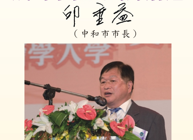
印重益 (中和市市長)

印重益市長肯定雙和對中和市民的醫療服務 長久以來，中和市市民若有就醫需求，總是要搭車前往台北市或他地就醫，才有更多醫療資源可供選擇，不僅舟車勞頓且耗費時間，更讓行動不便的老人或是弱勢者望之卻步而延誤就醫。 這主要是因為縣市的醫療資源分配失衡，中和市民遇有重症患者及緊急醫療需求時，常發生醫院病床數不足，而無法順利住院接受治療；或是錯失了黃金急救的時機，不能將病人的傷害降到最低。 自從雙和醫院於97年7月開始營運後，這項困擾市民的問題終於解決了不少，雙和不僅著重發展全方位的醫療服務，並積極的融入在地，如提供免費接駁車以利民眾就近地順利就醫；且持續地舉辦社區健康講座、社區巡迴義診，希望以此讓民眾獲得正確的保健觀念，進而預防種種疾病的發生。 對中和人來說，這的確是個好消息，再加上其許多重量級的先進醫療儀器，及陣容堅強的專業醫療團隊，讓一般疾病或是重症患者，都能獲得妥善而有效的醫療服務，儘可能地讓市民朋友在短期內恢復健康。此外，醫療人員的專業與貼心照護，尤其能展現出以人為本、視病如親的最佳價值及服務口碑。連院內的志工朋友們，也總是和藹可親地導引民眾就診，讓就醫病患與陪診朋友都能感受到整體醫療服務的高品質。(文轉次版)