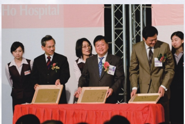
左起:邱文達校長、邱垂益市長、周錫璋縣長等貴賓於雙和留下手印,一起「手」(守)護大家的健康!

由這些便利市民的服務,可感受雙和醫院對社區的用心經營;未來,希望院方繼續關懷社區居民的需求,並與地方保持良好的互動。相信市民朋友也樂見雙和醫院成為大家的好厝邊,期盼院方以優質的醫療服務與照護,不僅守護好市民的健康,也讓地方更為繁榮。