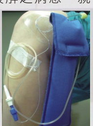
圖為局部疼痛控制幫浦

為此,雙和骨科特別引進「局部疼痛控制幫浦」來解決術後疼痛之問題,不僅可減少使用強效止痛藥劑量,同時,因使用止痛藥物所引起之副作用,如腸胃不適、藥物過敏、食慾降低,甚至噁心嘔吐等情形也隨之減少,使患者能更快復原。